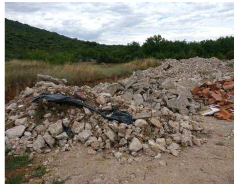
Slika 14. Nepropisno odbačeni glomazni otpad