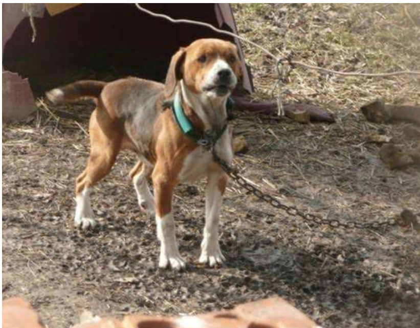
Slika 11. Pas Garo - nisu osigurani primjereni uvjeti za normalan život