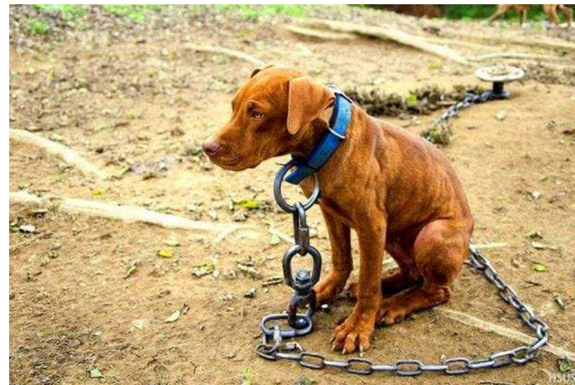
Slika 12. Pas Floki -nisu osigurani primjereni uvjeti za normalan život