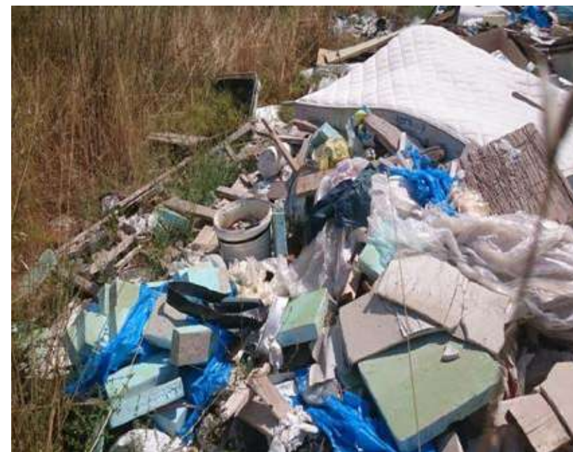
Slika 13. Nepropisno odbačeni glomazni otpad